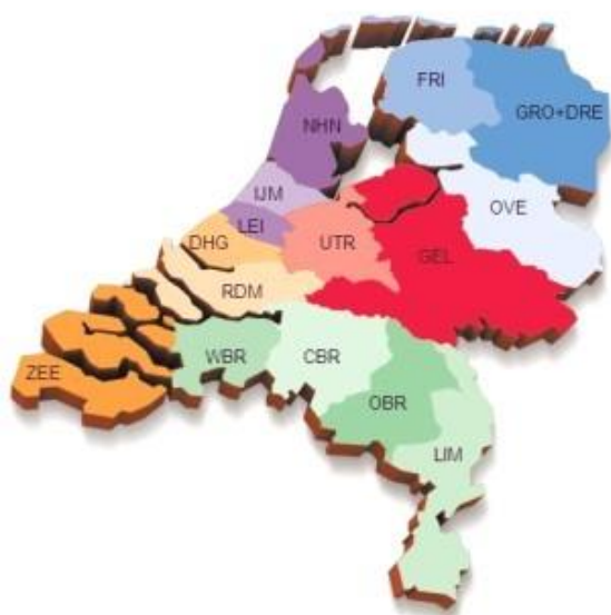
Afbeelding 1. Nederland in districten

Voor welke vragen kan je terecht bij een DISCOA?